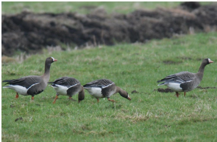
Zwerggänse und Blessgänse im Pulk