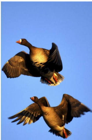
Blessgans juv. u. ad.

Die Blessgans ist ebenfalls eine Art, bei der wir sozusagen in Konflikt geraten, wenn wir uns Gedanken über eine Intensivierung der Bejagung dieser Art machen. Es besteht eine sehr große Gefahr der Verwechslung mit Zwerggänsen.