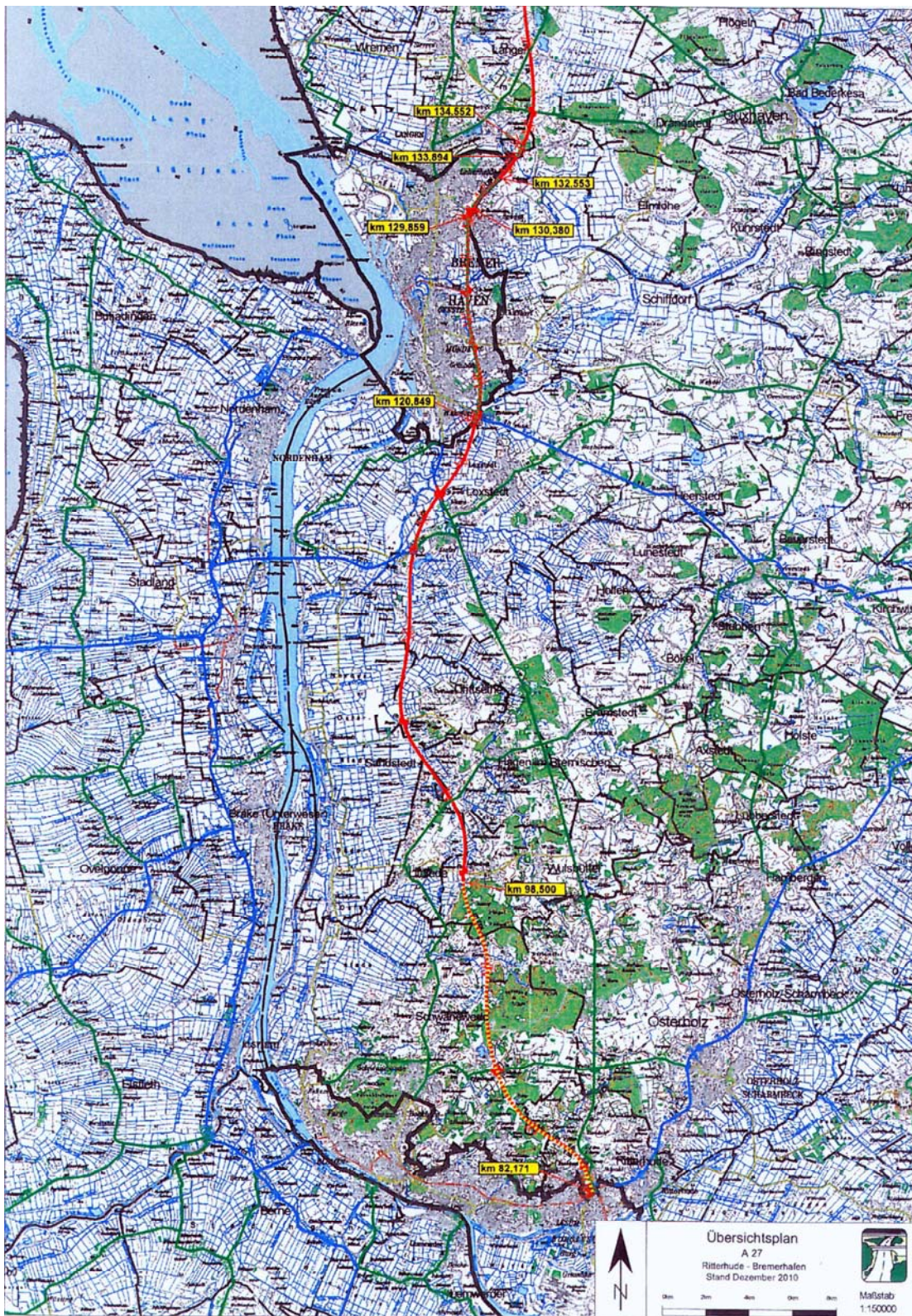
Anlage 1 (zu Artikel 1 Absatz 1 und 2)