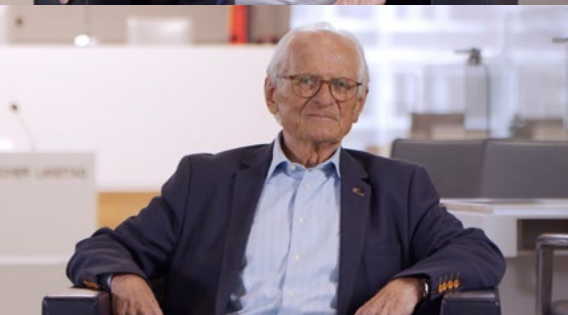
Fotos: Screenshots aus den Videobeiträgen; Videos produziert von sendefähig GmbH